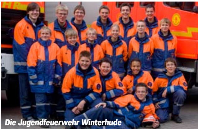
Die Jugendfeuerwehr Winterhude