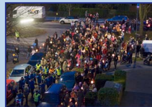
Mehr als 800 große und kleine Besucher zogen mit der Freiwilligen Feuerwehr Winterhude durch die Straßen der Jarrestadt.

Musikalisch begleitete der Meissner Spielmannszug aus Schenefeld die Laterneläufer. Am Feuerwehrhaus gab es anschließend heiße Würstchen und Getränke. Die FF Winterhude freut sich eine weitere erfolgreiche Veranstaltung im Stadtteil etabliert zu haben. Der erste Umzug startete vor zwei Jahren mit etwa 200 Besuchern. Auch im nächsten Herbst ist wieder ein Umzug geplant.