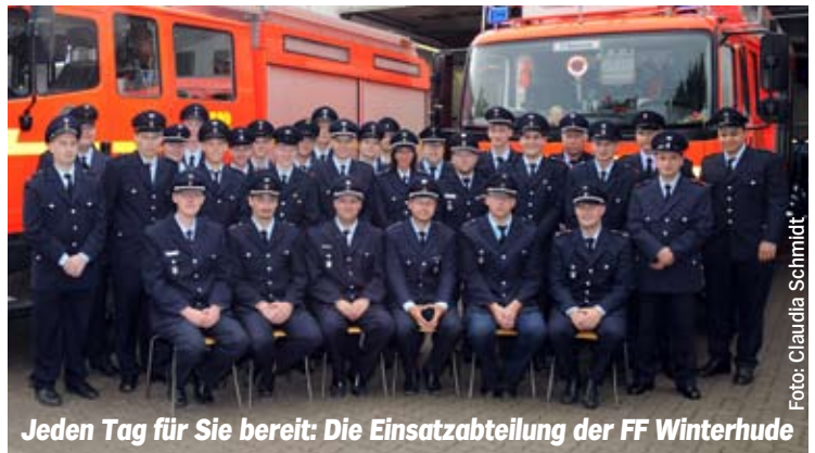
Jeden Tag für Sie bereit: Die Einsatzabteilung der FF Winterhude