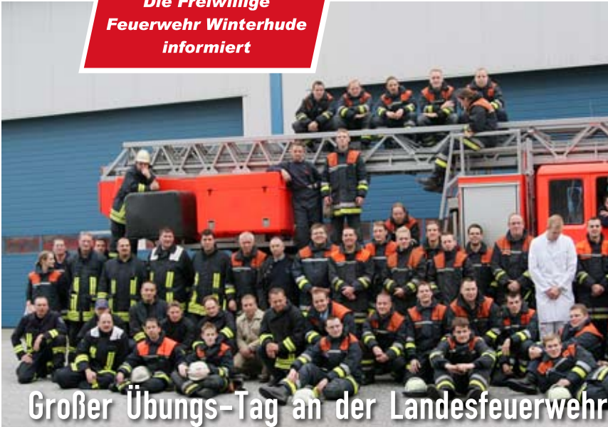
Großer Übungs-Tag an der Landesfeuerwehr-Schule

Die Freiwillige Feuerwehr Winterhude informiert